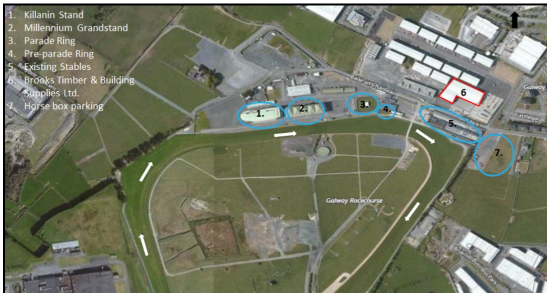
Fíor 1 Suíomh an Láithreáin – Ráschúrsa na Gaillimhe & Brooks

Tá an foirgneamh agus na tailte atá á n-áitiú ag Brooks Timber and Building Supplies Ltd (“Brooks”) suite go díreach ó thuaidh ó Ráschúrsa na Gaillimhe agus taispeántar iad, laistigh d’imlíne dhearg, i bhFíor 1 thíos agus faightear rochtain orthu ó Ascaill an Ráschúrsa. Tá Brooks ina thionónta sa láithreán seo agus tá corradh beag le 7 mbliana fágtha sa léas atá acu. Mar is léir san fhíor sin, tá na saoráidí eachaíochta suite ar an taobh thoir agus tá na saoráidí do dhaoine suite ar an taobh thiar.